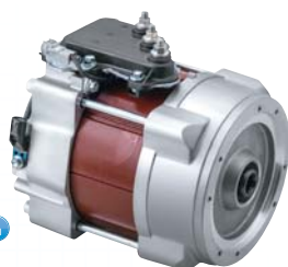
ACモータ 量産品 AC Motor IA180