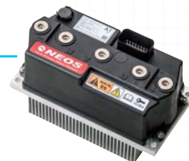
モータコントローラ 量産品 Motor Controller M type

世界で活躍しているフォークリフト用コンポーネントを様々な産業用車両へご提案します。