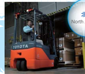
北米 North America